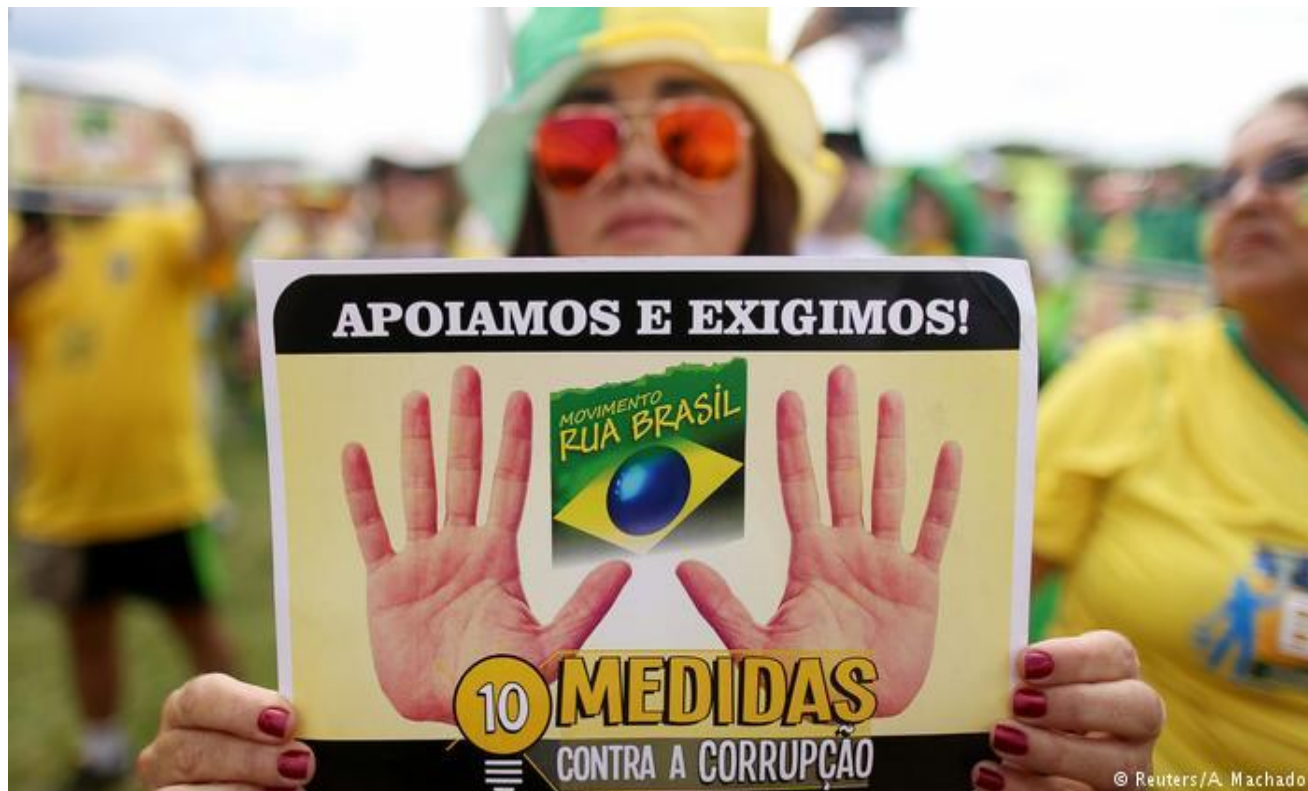
Protesty przeciwko korupcji w Brazylii

Barometr Korupcji sporządzono na podstawie ocen ekspertów, instytutów oraz ośrodków dialogu i analiz – think tanków – z całego świata (m.in. Banku Światowego, Fundacji Bertelsmanna, organizacji pozarządowej Freedom House).