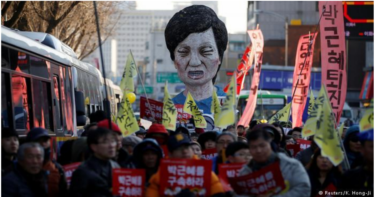
Protesty w Korei Południowej przeciwko premier Park Geun Hye