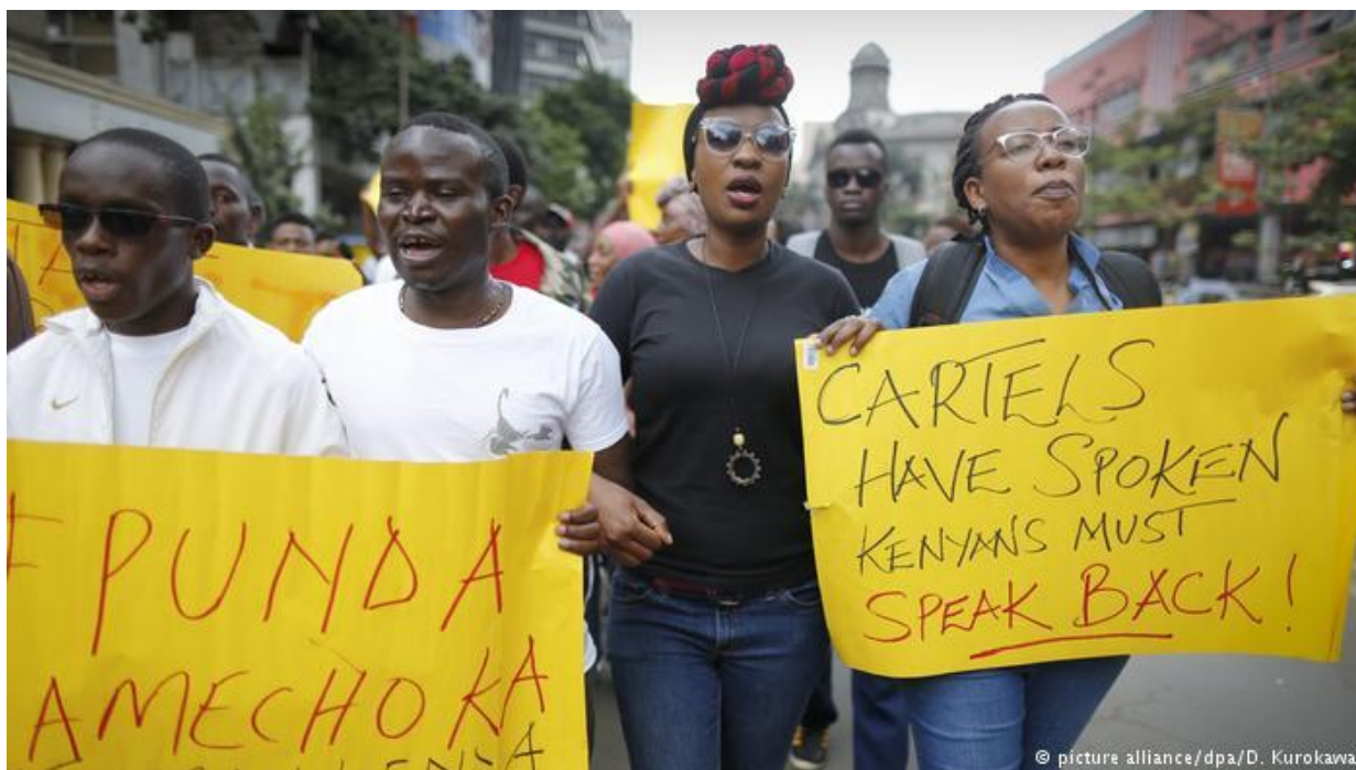
Protesty przeciwko korupcji w Kenii

Najbardziej podatny na korupcję jest sektor budowlany, tzw. zamówienia publiczne, czyli procedury zakupu w ramach przetargu - mówi Rogge. Poczucie winy mają wszyscy, ale próbują o tym nie pamiętać tłumacząc, że inni też by tak postąpili, aby zapewnić zlecenia swojej firmie czy zakładowi – mówi Rogger.